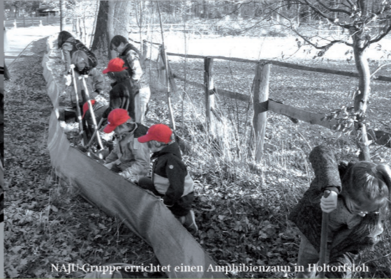
NABU-Gruppe errichtet einen Amphibienzaun in Holtorfslöh