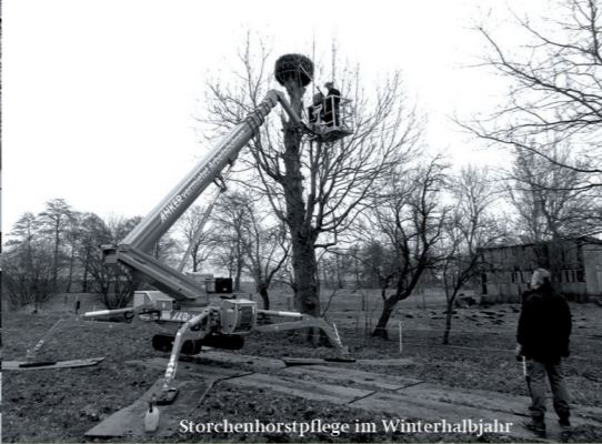
Storchenhorstpflege im Winterhalbjahr