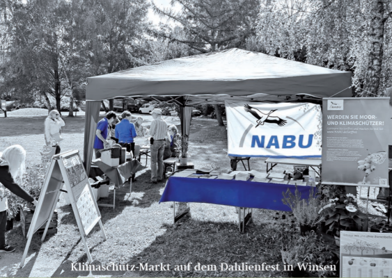
Klimaschutz-Markt auf dem Dahlienfest in Winsen